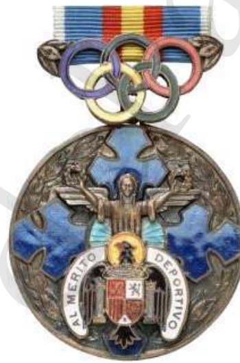
MEDALLA DE BRONCE, PRÁCTICA DEPORTIVA