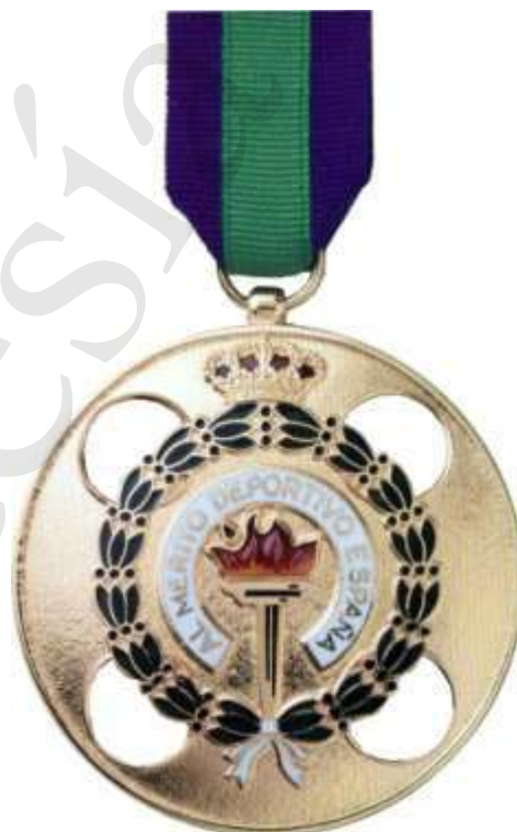
MEDALLA DE ORO