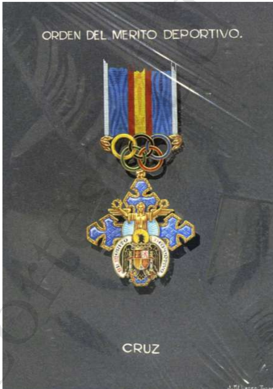
DISEÑO PROPUESTO PARA LA MEDALLA DE LA ORDEN DEL MÉRITO DEPORTIVO 1952

Los condecorados con las Medallas de Oro, Plata y Bronce podrán usar habitualmente, los primeros una miniatura de la misma, que será llevada en el ojal, y los poseedores de la Medalla de Plata y Bronce, una roseta del color o colores que correspondan a la cinta de su Medalla respectiva y en cuyo centro figuren los aros olímpicos en plata o bronce, conforme a su categoría.