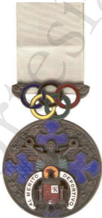
MEDALLA DE BRONCE, OTROS MÉRITOS